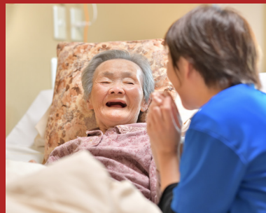
Methode Beelden van Kwaliteit