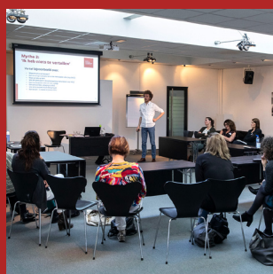
Presentaties IGJ, Surplus, Waarde-vol onderwijs, Communicatie