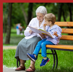
Methodiek Betekenisvolle rollen