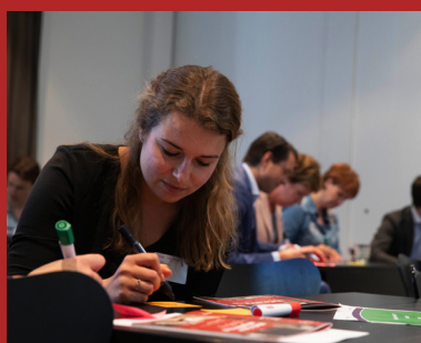
Tips schrapsessie regeldruk