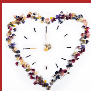
Van aangestuurde naar samenverantwoordelijke teams voor welzijn