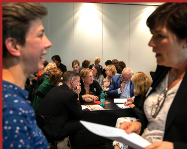
Ook bestuurlijk leiderschap op de schop