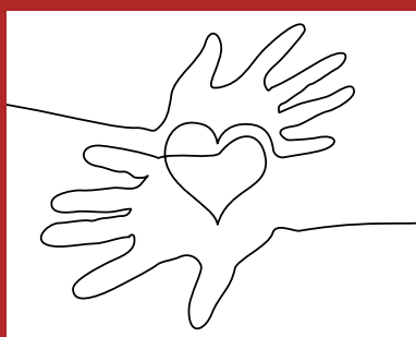
Elkaar versterkende behandeldiensten en zorgteams