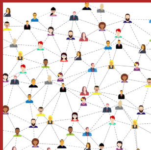
Mensen in hele organisatie betrekken